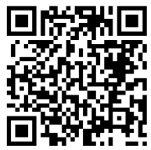
桃園市公立及非營利幼兒園 招生網